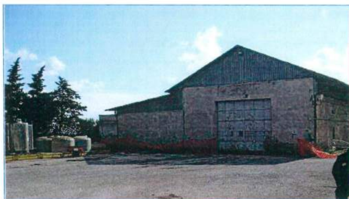
Figura 2: Deposito