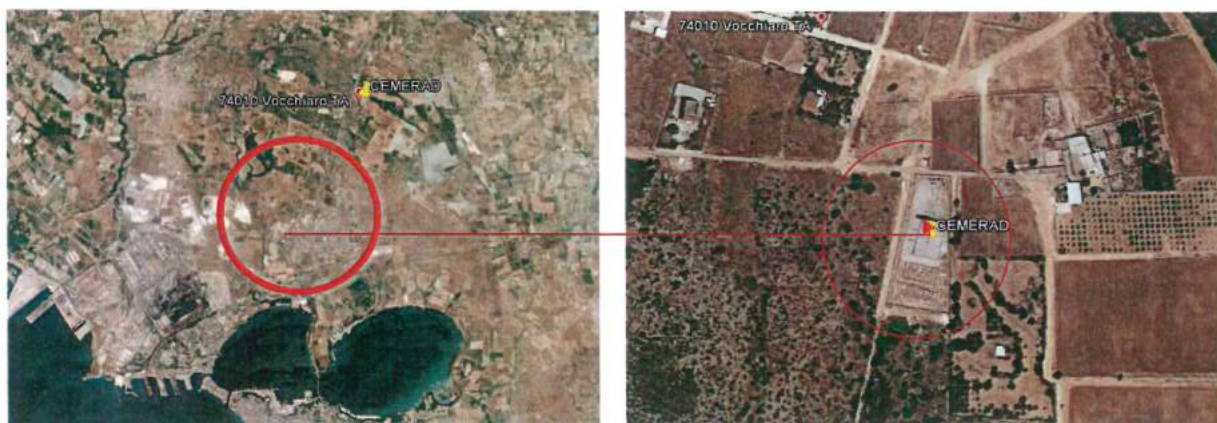
Figura 1: Individuazione dell'area di interesse

Il sito ex CEMERAD, ubicato in località Vocchiaro - Grottafornara, nel Comune di Statte (TA), [figure1-figura2], è collocato a circa 6,4 km dal centro urbano di Statte (abitanti circa 14.000), a circa 4,4 km dal centro urbano di Montemesola (circa 4.000 abitanti) ed a circa 6,5 km dal centro urbano di Crispiano (circa 11.900 abitanti); la città vecchia del comune di Taranto si trova ad una distanza di circa 10,8 km. A meno di 3 km si trovano alcune masserie sparse, piccoli nuclei abitati, l'ospedale S. Giuseppe Moscati ed una centrale dell'acquedotto; a meno di 5 chilometri è ubicato invece il quartiere urbano Paolo VI (circa 14.000 abitanti) nel quale sono localizzati una sede dell'Università degli Studi di Bari ed una sede del Politecnico di Bari.